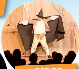
PIECE DE THEATRE