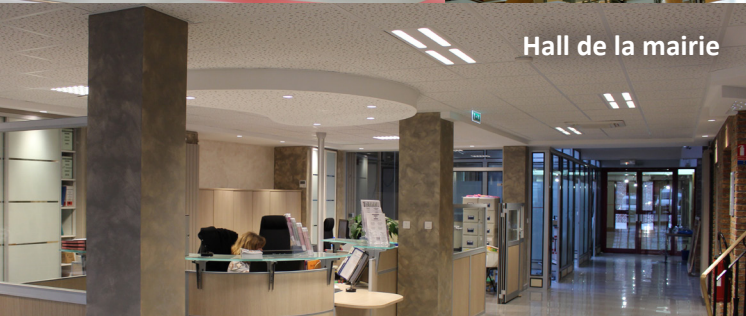
Hall de la mairie