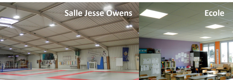
Salle Jesse Owens