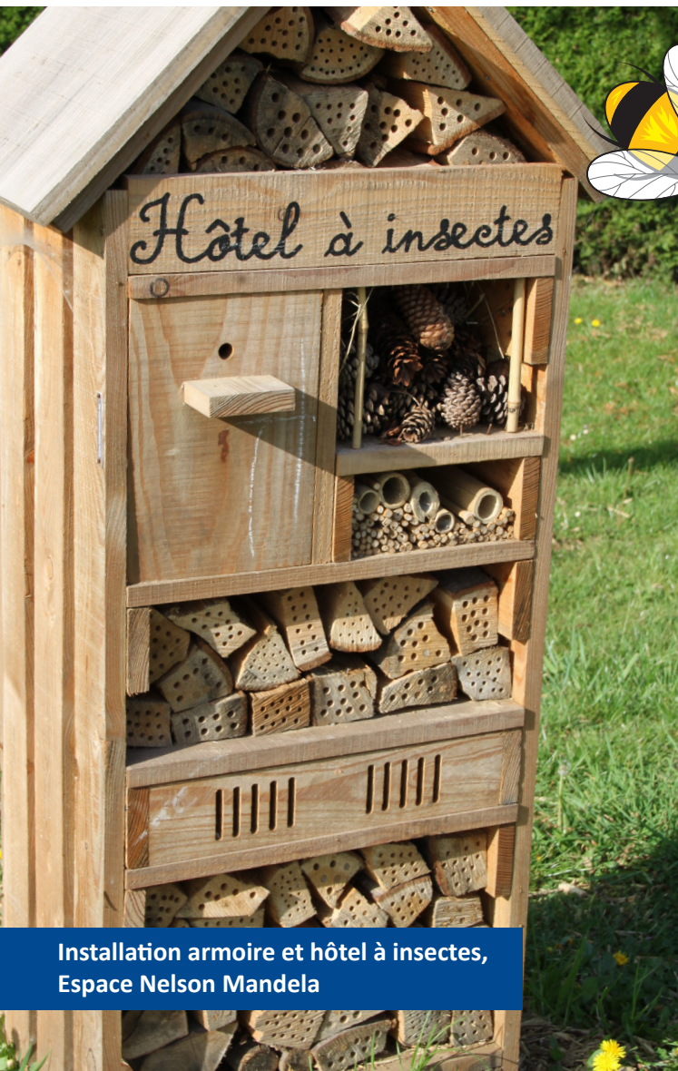
Installation armoire et hôtel à insectes, Espace Nelson Mandela