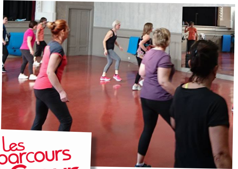
Parcours du cœur scolaire