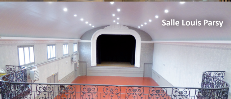
Salle Louis Parsy