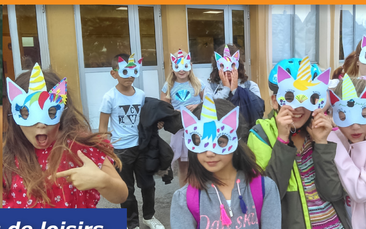
Accueils de loisirs