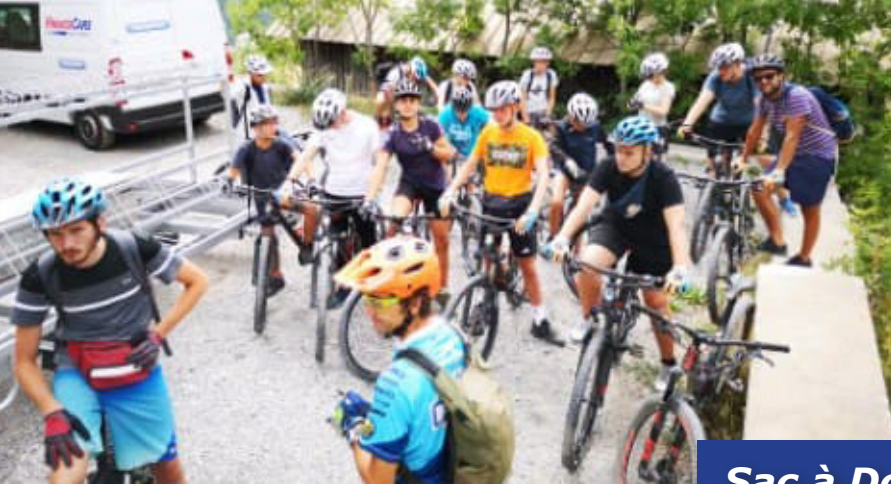
Sac à Dos