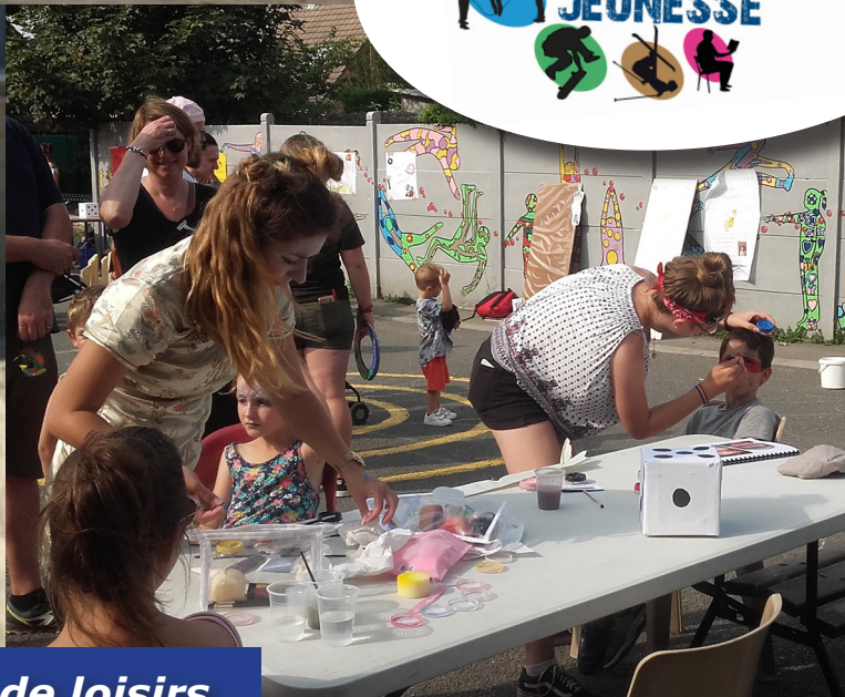
Accueils de loisirs