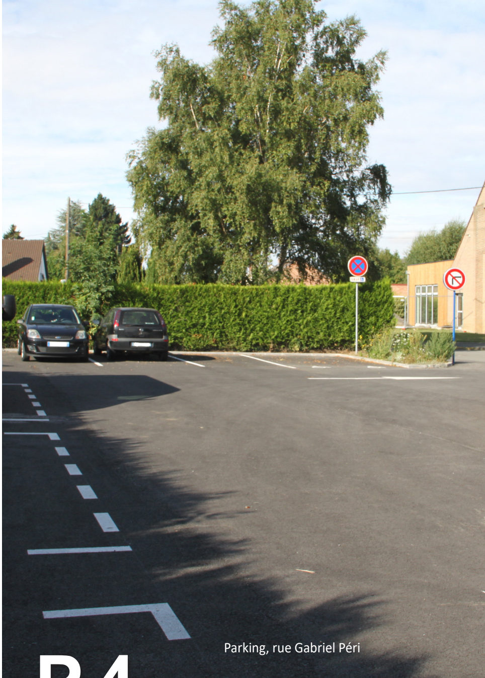
Parking, rue Gabriel Péri